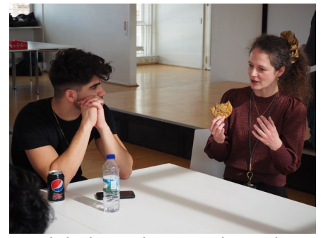
En del elever benyttede muligheden af at møde en professionel statistiker og stille spørgsmål til både arbejde og studium.

En af de store oplevelser for eleverne er altid at møde de professionelle matematikere fra virksomhederne, her statistikerne fra Novo Nordisk. Også i denne film er det meget unge aktører, der nok for mange af eleverne fremstår som en art rollemodel.